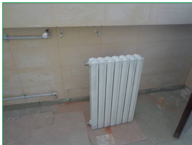
Corp C – vopsire radiatoare fontă