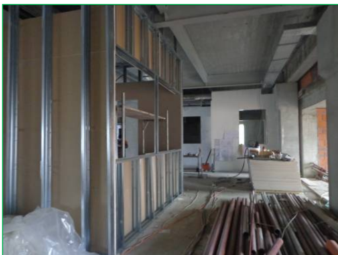
Corp B – Compartimentări gips carton