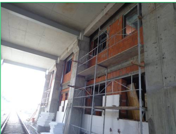
Corp B – Aplicare polistiren