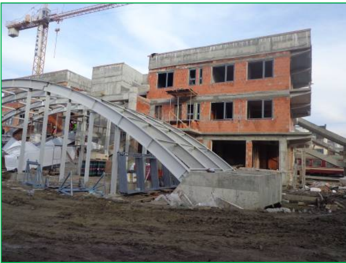
Corp A – Tâmplărie