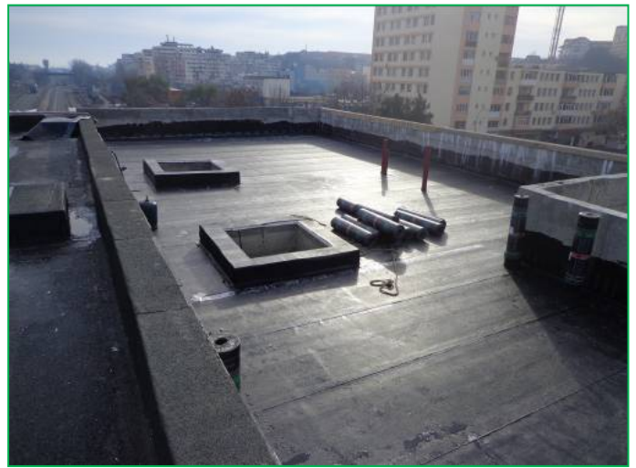
Corp A – Finalizare hidroizolație terasă