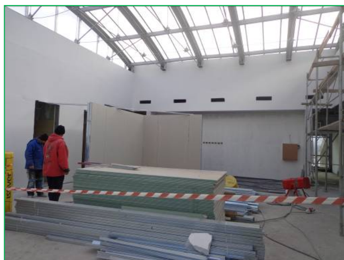
Corp B – Mascare grinzi metalice