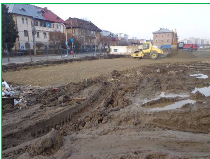
Parcare – Compactare umplutură balast Bd.Republicii