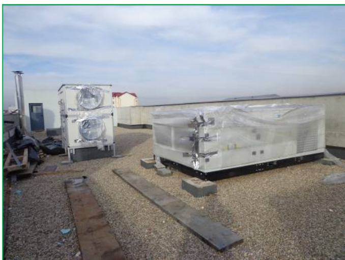
Corp C – Rooftop și recuperatoare de căldură